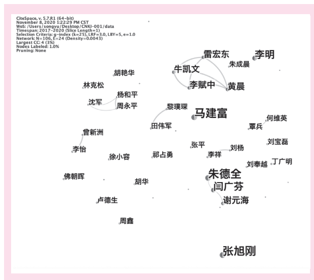
图 1 核心研究者可视化图谱

如图 1 所示,圆点代表作者,圆点和作者名字的大小表示文章数量的多少。部分面积较小的圆点,作者姓名未显示在图中的,是由于文章数量低于设置的阈值而被排除。部分圆点之间有连线,这表示一些作者与作者之间存在合作发文的关系。