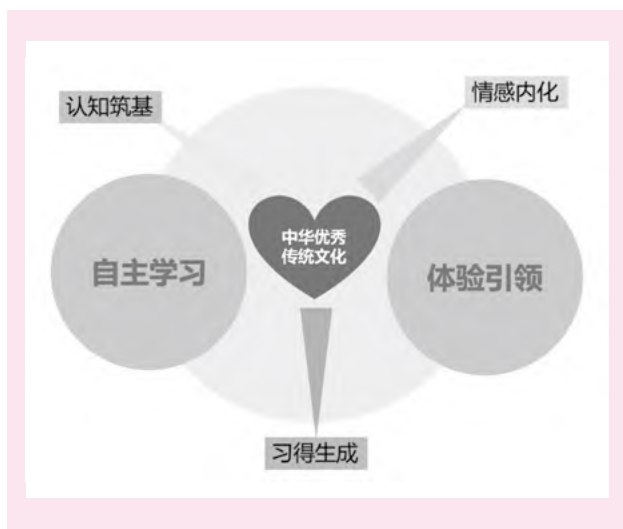
图1 “一核中心、两轮驱动、三维链接”结构图

在此,我们基于在武汉市典型高职、中职学校调研资料、理论研究、文献学习及课堂教学基础等,整合相关体会、思考及分析成果,提出在职业院校开展中华优秀传统文化数字化教学实践的框架性操作设计方案:一核中心、两轮驱动、三维链接、十台展播。此设计可以供参照、借鉴,深入研究及辐射推广。“一核中心、两轮驱动、三维链接”结构如图1所示。