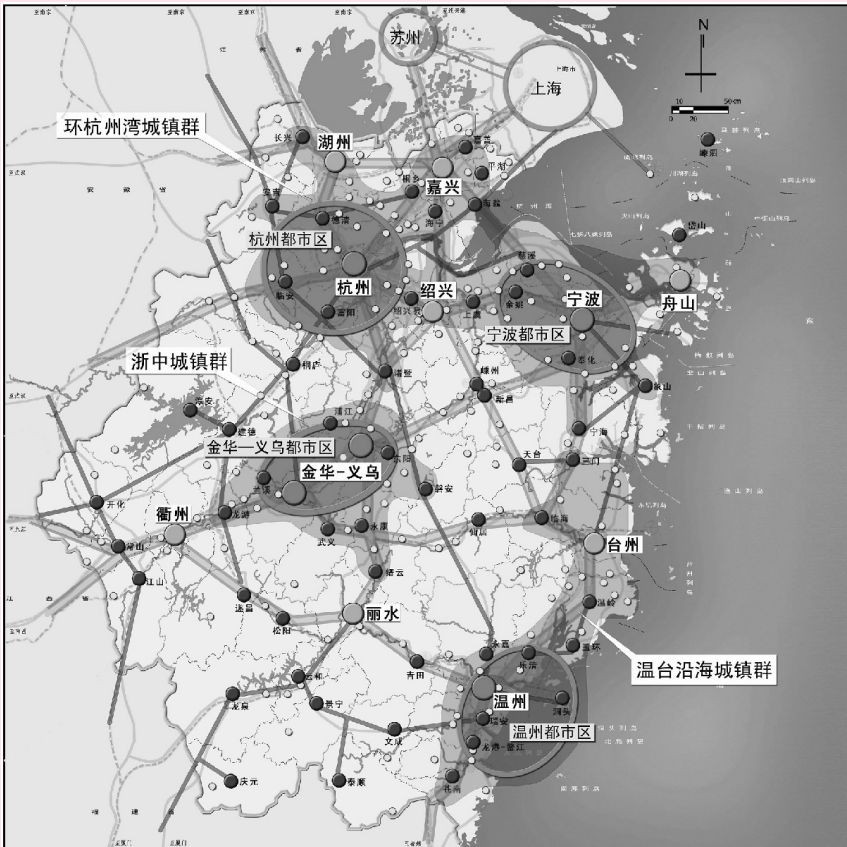
图 2 浙江省城镇空间格局