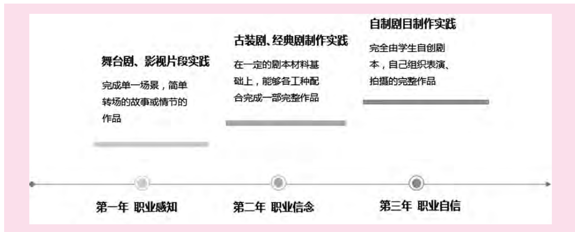
图2 基于人才培养能力的“产品导向 联合作业”实践课程体系示意图

通过该实践课程体系,力争使影视艺术专业集群内的各专业的学生,实现“产生职业感知——树立职业信念——形成职业自信”的影视制作职业人的培养,使学生具有强烈的从事本专业工作的职业热情和职业技能。同时,学生通过完成系列实践课程,不仅演练实操理论教学内容,获得与影视剧组实践相似的演艺经历,同时通过小剧组的工作模式和自制剧成品的展示,使其感受职业成就,树立职业信念,提升职业自信。