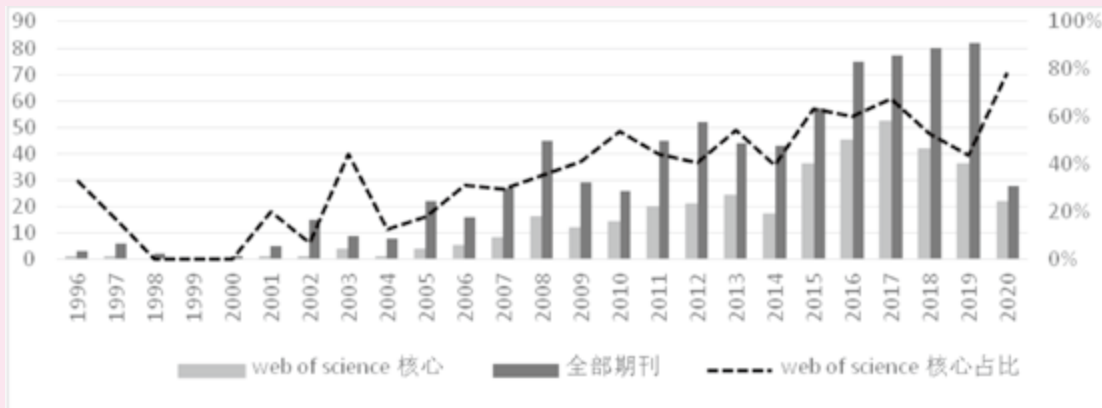
图 2 1996—2020 年区域旅游合作国外文献数量

图 2)。总发文量与核心及以上刊物发文量走向基本一致,从 2014 年起,发文量呈连续上升趋势,且发展势头迅猛,2017 年以后发文量呈明显下降趋势。国外核心文献的占比基本呈现每年上升趋势,文献质量有所提高。