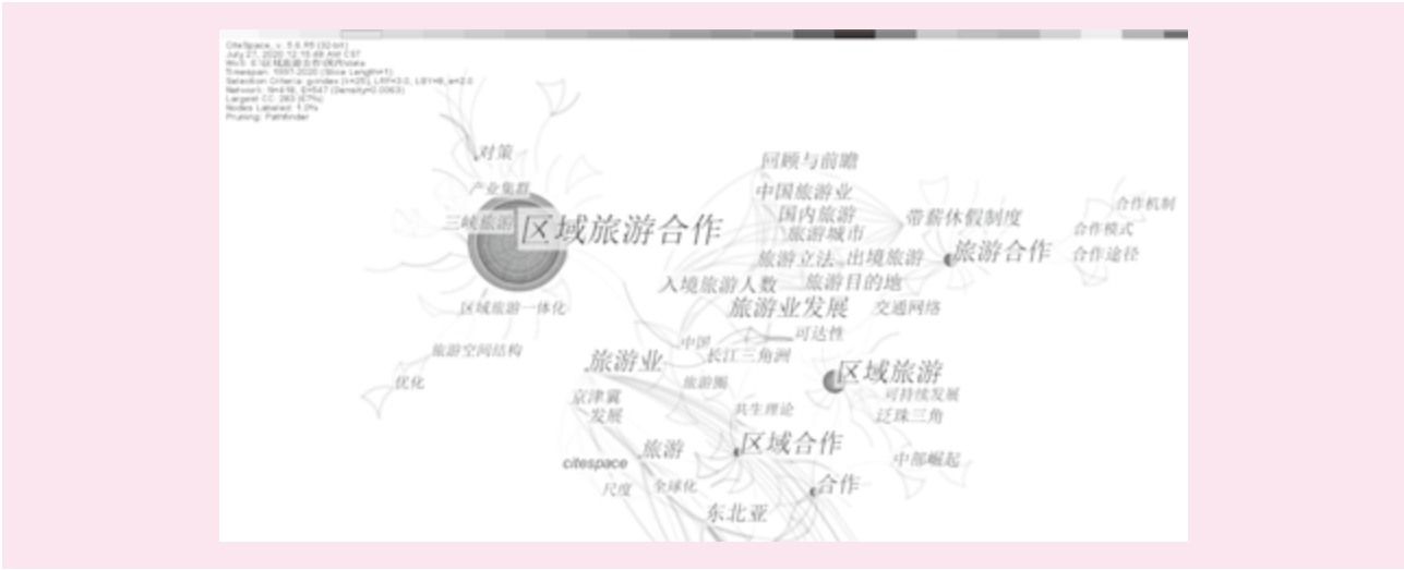
图 3 国内期刊关键词共现图谱

次 12, 中心性 0.14)、对策(频次 12, 中心性 0.03)、旅游(频次 10, 中心性 0.13)、动力机制(频次 7, 中心性 0.02)、中国(频次 6, 中心性 0.19)。