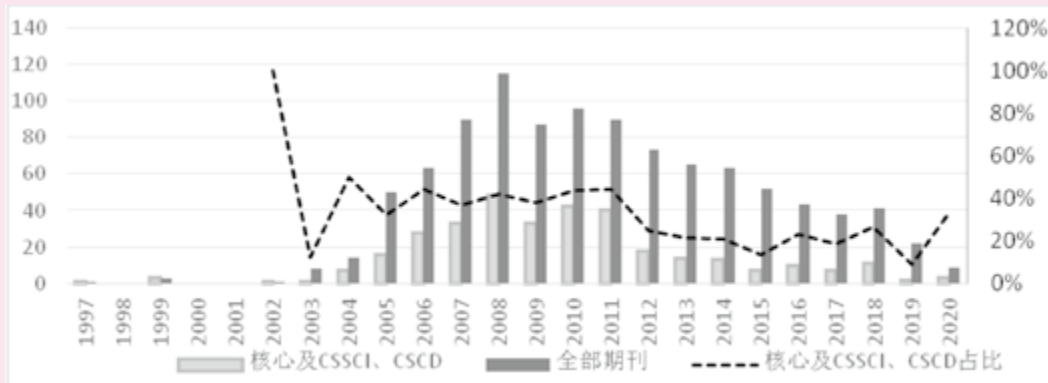
图 1 1997—2020 年区域旅游合作国内文献数量

数据,共检索到核心及以上期刊文献 338 篇(见图 1)。总发文量与核心及以上刊物发文量走向基本一致,从 2003 年起,发文量呈连续上升趋势,且发展势头迅猛,2011 年以后发文量呈明显下降趋势。核心及 CSSCI、CSCD 占比基本呈现 30%~40% 左右波动,占比幅度变化不大。