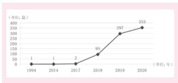
图1 乡村振兴背景下职业教育研究文献数量年度分布图

利用 Bicomb2 软件对样本文献的数量和年代进行统计,并依据统计结果绘制出如图 1 所示的乡村振兴背景下职业教育研究成果数量年度分布图。从图 1 中可以看出,我国关于“乡村振兴”和“职业教育”主题相关文献数量从 1994 年开始整体呈现出递增态势,特别是自 2017 年乡村振兴从国家层面提出后,该领域研究在 2018 年以后得以快速发酵与加速成长,