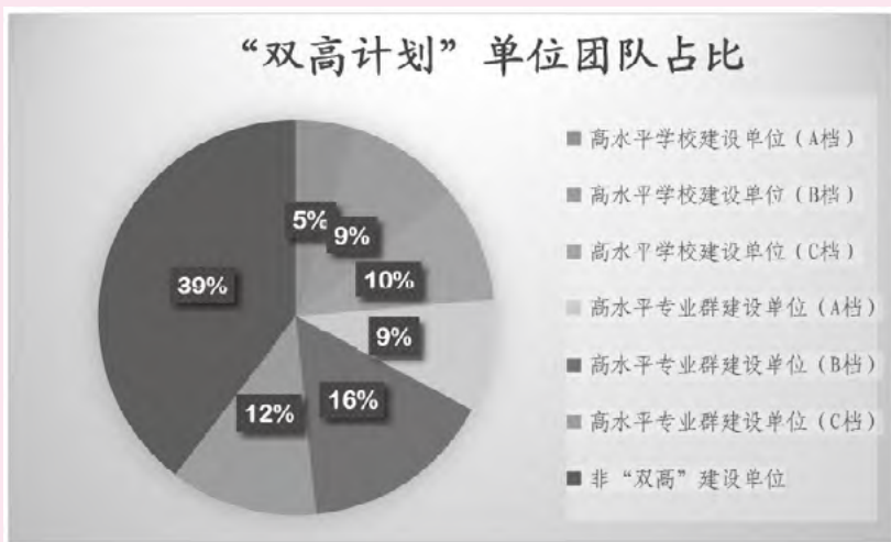
图3 两批国家级创新团队中“双高计划”单位占比图

标杆和典型,力争做到世界一流。如图3所示,两批国家级团队中,“双高计划”建设单位立项建设团队220个,占比60.45%;非“双高计划”院校立项建设团队144个,占比39.55%。创新团队建设要紧密对接“双高计划”,高标准严要求,共同聚焦解决职业教育的核心问题,同步实施、协同推动、形成合力。乘着创新团队建设的东风,深化“三教”改革,打破学科教学的传统模式,采用项目式教学、情景式教学等新教法,提升教师教学、团队协作、信息技术应用能力,探索职业教育教学模式范式,落实“走出去”战略,不断提升我国职业教育的国际影响力和竞争力。