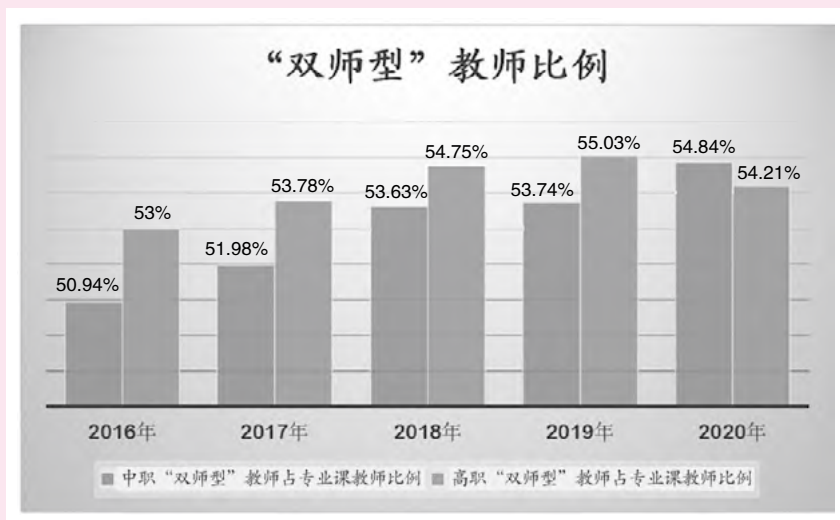
图1 中高职“双师型”教师占专业课教师比例图

如图1所示,目前中高职“双师型”教师占专业课教师比例达到《职业教育提质培优行动计划(2020—2023年)》要求,均已超过50%,但是增长乏力,其中2020年高职“双师型”教师占专业课教师比例较2019年还略有下降。此外,“双师型”教师水平不一,地区、专业不均衡,各地认定的尺度也不一致,在突出“双师”素质还是“双师”结构上还存在较大争议。把所有专业教师培养成“双师型”困难较大,在今后一段时期内,通过教师教学创新团队建设,培养一批“双师型”专业带头人、骨干教师,引进一批来自企业一线、熟悉产业的专兼职教师,可以有效解决“双师”素质不高、“双师”结构不合理等难题,以此辐射带动全国职业院校加强高素质“双师型”教师队伍建设,适应职业教育改革的现实需要 [7-11] 。