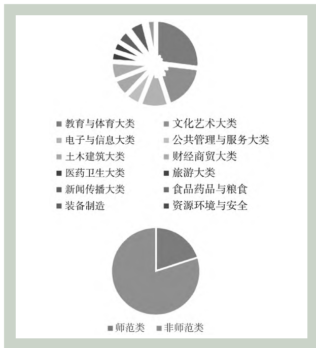
图 1 幼师高专专业结构及专业布点的统计图示

品药品与粮食、装备制造、资源环境与安全、交通运输 13 个大类,对接文化、旅游、健康、养老、育幼、体育、家政 7 个产业的人才培养。从专业布局的目录结构看院校之间存在很大的不平衡,不少专业布点,如数学教育、小学数学、学前教育(男生免费)、体育保健与康复、产品艺术设计、音乐剧表演、动漫制作技术、智能产品开发与应用等,开设的学校只有 1 所。在 2023 年专业大类中,教育与体育类专业设置占比 27%,其中,师范类专业开设占比达 20%(如图 1),以湖北幼专为例,学前教育专业学生占全校学生的 66%,这种“一类独大”“一专独大”的局面(如图 2),不利于学校综合向上突破性发展。