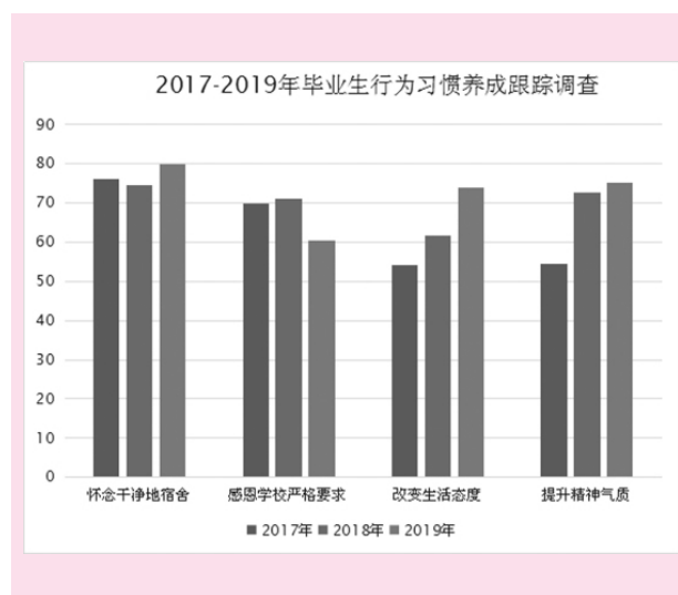
图2 2017-2019 年毕业生行为习惯养成跟踪调查