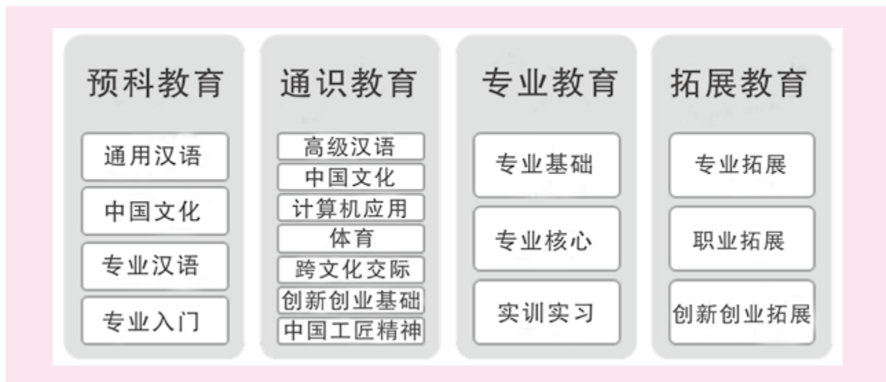
图2 来华留学生课程体系

教学体系主要包括建立完善的留学生课程体系和实施合理的教学编排。教育部规定来华留学生入学标准中,以中文为专业教学语言专业的中文能力要求应当至少达到《国际汉语能力标准》四级水平。鉴于此,可将留学生课程体系分为预科教育、通识教育、专业教育、拓展教育四大模块(见图2)。