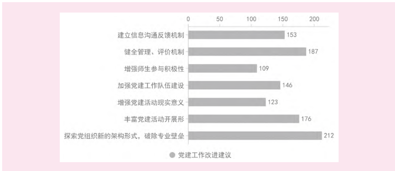
图2 高校基层党员对党建工作改进的建议